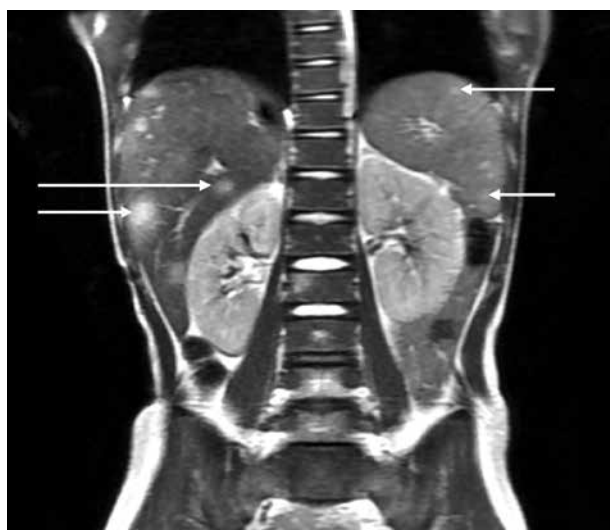
Figura 3. Múltiplos nódulos hepáticos e esplênicos com hipersinal visíveis na imagem de ressonância magnética.