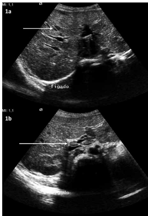
Figura 1. Nódulo hepático hipocogénico com 11,8 mm de diâmetro (1a) e adenopatias hilares, a maior com 14,4 mm (1b), visíveis na ecografia abdominal.

Keywords: Child; Bartonella Infections/diagnosis; Cat-Scratch Disease; Fever of Unknown Origin/diagnosis; Lymphadenopathy/diagnosis